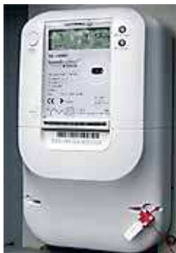
Box mit GPRS-Sender und PLC System