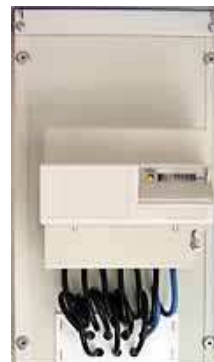
Box ohne Sender aber mit PLC System

Erste Wirkungen: Viele körperliche und seelische Beschwerden bei Menschen, ungeheure Schlafstörungen, andauernder kurzer Stromausfall, Lampen explodieren, Mobilverkehr teilweise zusammengebrochen, Telefone funktionieren nicht, Stromstärke und Strahlung in der Stromleitung unglaublich gestiegen, Computer knacken furchtbar, Internet und Mailverkehr humpelt, Lampen flackern die ganze Zeit usw. Auch die EI-Allergiker fallen haufenweise um und fühlen sich sterbend. Viele zeigen jetzt schon Persönlichkeitsveränderungen und andere Bewusstseinsstörungen, besonders im Bezug auf das Gedächtnis. Alles nur, wegen diesem kleinen Sender, der eigentlich keine Beeinflussung auf das Stromnetz haben sollte. ODER ?